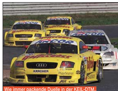
Wie immer packende Duelle in der KEIL-DTM..

Deshalb dürfen Gäste bei den KEIL-DTM Rennen mitfahren. Die Gäste sind auf dem einzelnen Rennen voll startberechtigt. Sie werden aber nicht in der KEIL-