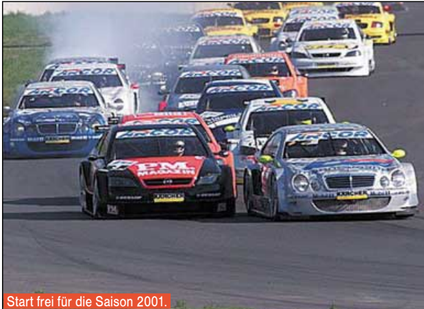
Start frei für die Saison 2001.

DTM Piloten dementsprechend aufrücken können.