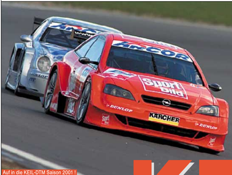
Auf in die KEIL-DTM Saison 2001!

Seit sieben Jahren gibt es jetzt die KEIL-DTM. 1994 war sie der erste Standardmarkenpokal der deutschlandweit ausgetragen wurde. Die KEIL-DTM ist damit ein Pionier der Standard-Idee für größtmögliche Chancengleichheit bei gleichzeitig reduzierten Kosten.